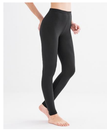
ウォームコアモイスト しっとりなめらか加工 10分丈レギンス2枚組