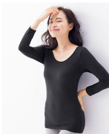
ウォームコアモイスト しっとりなめらか加工 2wayネック長袖インナー2枚組