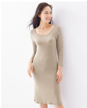
ウォームコアモイスト しっとりなめらか加工 2wayネック長袖スリッパ2枚組