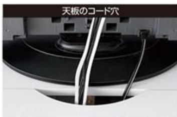
天板にコード穴があり、複数のコードをまとめて通すことができます。