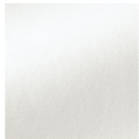
柔らかなピンポイントオックス織り