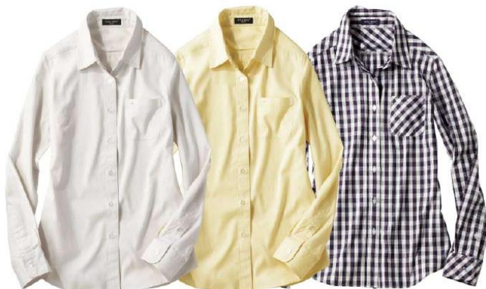
一着は持ちたい 基本カラー！