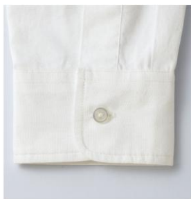
折り返してもきれいな細めの幅