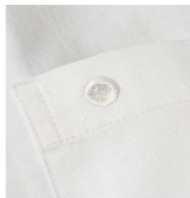
ピンバッジなどを飾れる穴付き